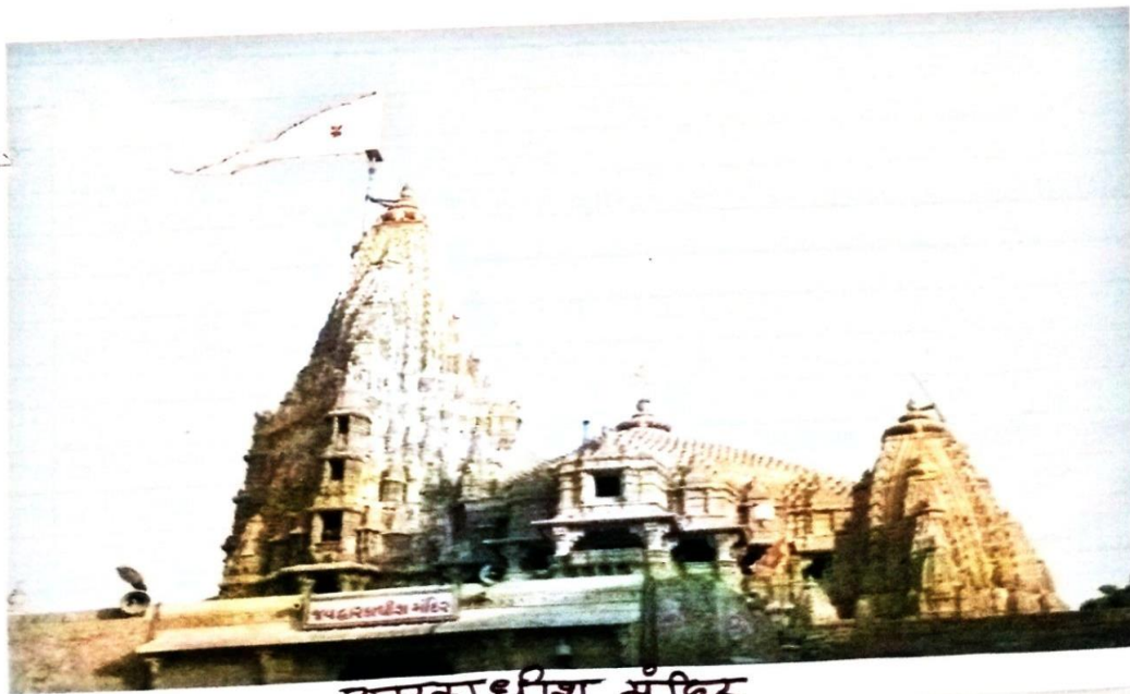
कालिकादेवी का मंदिर

PRINCIPAL Govt. Tulsi College Anuppur Distt. Anuppur (M.P.)