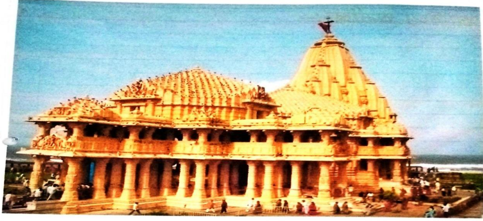
चित्र क्र. १. सौमनाथ मंदिर