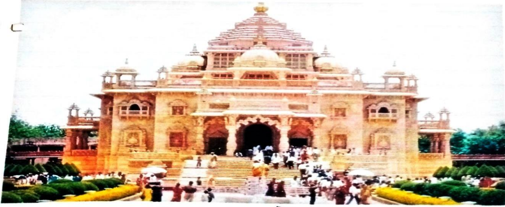
क्र. २ अक्षराधाम मंदिर

PRINCIPAL Govt. Tulsi College Anuppur Distt. Anuppur (M.P.)