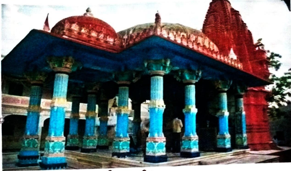
क्र०३ ब्रह्मणी का मंदिर